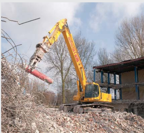
Sloop Kennemer College Heemskerk

branche vertegenwoordigd. Totaal of gedeeltelijke sloop. Van energiecentrales tot het slopen van woningcomplexen of renovatie- en restauratiesloop van historische gebouwen. En al deze projecten zijn uniek. Stuk voor stuk vragen zij om aandacht, inlevingsvermogen en een praktische oplossing. Daarom biedt Bentvelzen en Jacobs kwaliteit met een allround en praktisch karakter. Van ontwerp tot uitvoering.