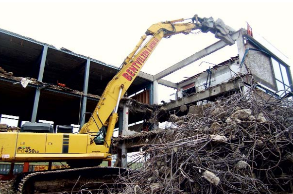
Sloop Zeevaartschool Den Helder

M et het verstrijken van de jaren is het traditionele familiebedrijf van weleer uitgegroeid tot een sterke en solide organisatie. Zo opereert Bentvelzen en Jacobs landelijk en is een van de toonaangevende bedrijven geworden binnen de branche van sloop-, demontage- en bodemsanering. Zij heeft de beschikking over vakkundige en goed opgeleide medewerkers, een geavanceerd machinepark en een schat aan kennis, ervaring en inzicht. Bentvelzen en Jacobs heeft zich voortdurend aangepast aan de veranderende wereld om hun heen. Toch is er een uitgangspunt nog steeds hetzelfde gebleven. Het leveren van "ambachtelijke kwaliteit in een moderne wereld."