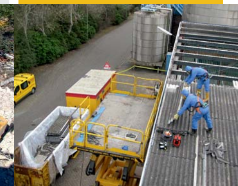
Asbestsanering Crown van Gelder NV Velsen-Noord