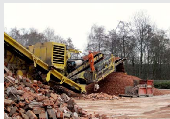
Breken van 14.000 ton puin tot granulaten Kennemer College Heemskerk

Voor veel mensen uit de IJmond is het een bekend pand, het Kennemer College aan de Velst in Heemskerk. Bentvelzen en Jacobs mocht enkele weken geleden aanvangen met de totaal-sloop van dit gebouw dat bekend staat als een van de grootste schoolgebouwen van Noord-Holland. De circa 8 ha grond, dat vrij komt zal door "Gem CV" (Gemeente Heemskerk en Woningcorporatie Woonopmaat) worden gebruikt voor woningbouw en voorzieningen in een waterrijke omgeving.